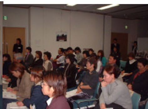
熱心に聴入る参加者