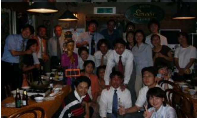
15年度3次隊のみなさん